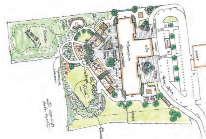
Utformning av lekplats på förskolan i Moheda

Ett av byggnationerna med den nya förskolan i Moheda är i gång. Under etapp 2 iordningställs utemiljön. Det blir en motorikbana, grillplats, pulkabacke, labyrint, klätterställning med mera. Slutbesiktning är bestämd till den 31 maj.