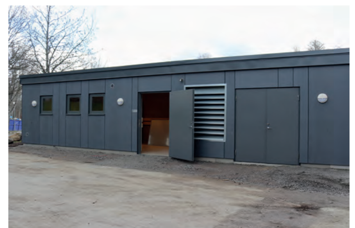
Bilder från renoveringen på Furuliden i Moheda