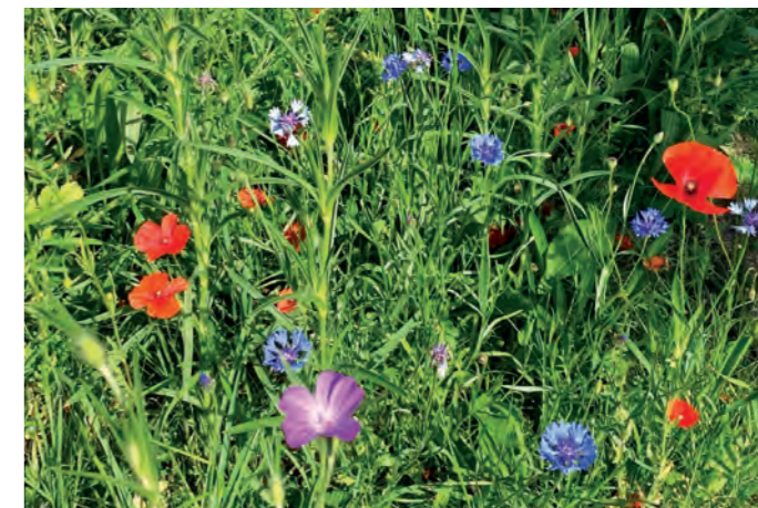
Text och bild: Ann-Charlotte Hermansson, Arbetsledare Utemiljö.

Som trädgårdsmästare blir man lite extra glad på våren när knoppar slår ut och allt det gröna börjar spira, äntligen får man ut och rensa ogräs och klippa gräs. Men för att gynna den biologiska mångfalden och för att minska användandet av fossila bränslen skall vi inte klippa så mycket gräs utan i stället ha ängar och ytor med lite högre gräs där alla småkryp trivs och har det bra. En äng kan var gigantiskt stor och omfatta fler tusen kvadratmeter men det kan också vara så litet